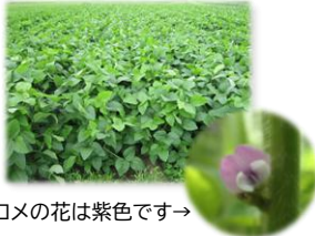
ミヤギシロメの花は紫色です→

「ミヤギシロメ」は岩沼地域で栽培されていた在来種から選り出され、現在、宮城県で最も古くからある優良品種です。