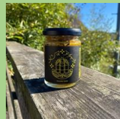
murata base 「メンマアチャール」