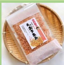
たみこの海バック 「香りおきあみ」

2025年8月1日から2026年3月31日までの間、 「おためし本舗試食屋イオンモール幕張新都心エキ マエ1階」で宮城県産品常設コーナーを設置中！ 詳しくは右記の二次元コードから チェック！ ※宮城県のホームページに遷移します