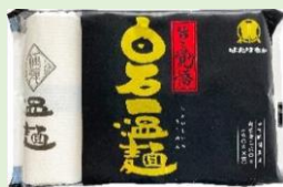
はたけなか製麺 株式会社 「白石一温麺」