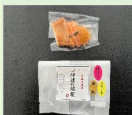
社会福祉法人 仙萩の杜 「伊達の燻製 おつまみセット」