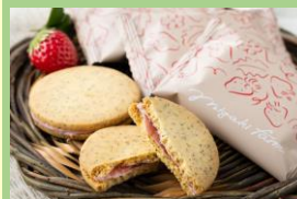
株式会社 GRA 「いちごミルクサンドクッキー」