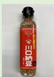
有限会社 川口納豆 「乾燥納豆」