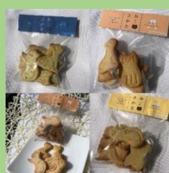
NEKO 株式会社 「ねことさかな 4 種セット」