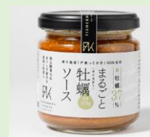
FISHERMANS' KITCHEN 「まると牡蠣ソース」