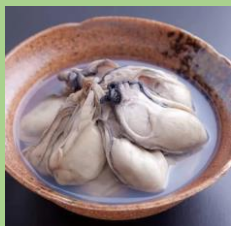
一般社団法人 カイタク 「牡蠣の潮煮」