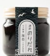
SEA SAW 「浜のりだれ」