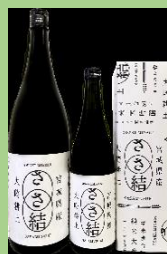
銘酒 和屋 「ささ結 純米大吟醸」