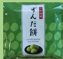
株式会社甘仙堂 「冷凍ずんだ餅」