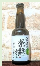
マジコ 「宮城の紫蘇香るクラフトビール」