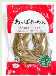
株式会社 あっぱれ 「あっぱれめん」