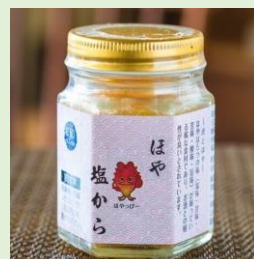
株式会社 三陸オーシャン 「ほや塩から」