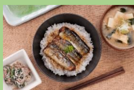
株式会社 阿部長商店 「三陸食堂 さんま蒲焼き」