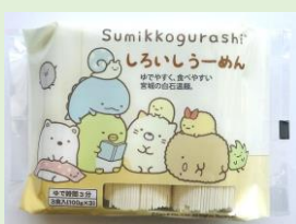
株式会社 きちみ製麺 「すみっくぐらししろうーめん」