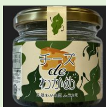
三陸わかめ屋ムラカミ 「チーズ de わかめ」