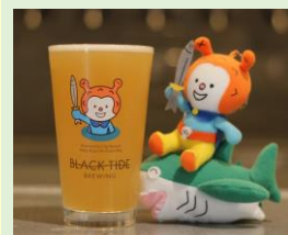
BLACK TIDE BREWING 「Hoya Boya」