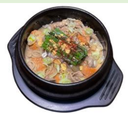
ケムリアブサン 「デモツム煮」