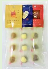
マリプロ 株式会社 「おや？三種のチーズセット」