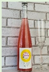
株式会社 MARS 「Nice Candy !」