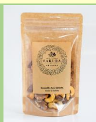
燻製工房おが太郎 「さくらチップで燻したミックスナッツ 塩塩の藻塩仕立て」