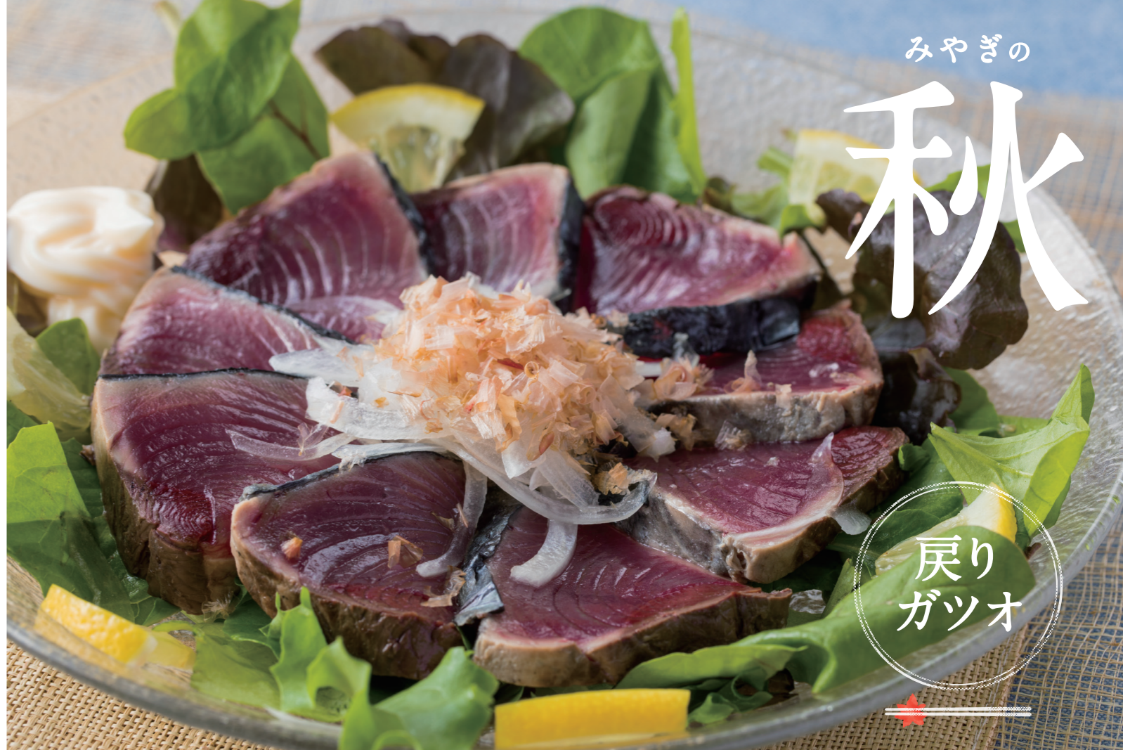
戻りカツオのタタキ