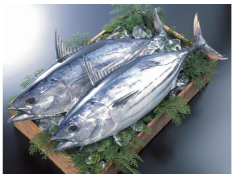
気仙沼市魚市場は、生鮮カツオの水揚げ量が21年連続日本一です。(平成29年現在)

宮城の海の幸を代表する魚の一つカツオ。宮城県の水揚げ量は全国5位（平成28年度）です。 カツオは旬が年に2回あり、6月から8月にかけて黒潮に乗り三陸沖に北上してくるカツオを「初カツオ」、9月頃から親潮に乗り南下してくるカツオを「戻りカツオ」と呼びます。 北の海でたっぷり餌を食べて成長し、丸々と肥えた戻りカツオは、身に脂を蓄え濃厚な味になります。 人気の食べ方は刺身。脂ののったカツオを、厚めに切り、薬味として刻みネギなどをそえて、生姜醤油やわさび醤油で食べます。 「タタキ」も定番の食べ方。新鮮なカツオの皮付きの切り身を表面だけ軽く炙り、手早く冷やして、薬味やポン酢などのタレをつけて食べます。