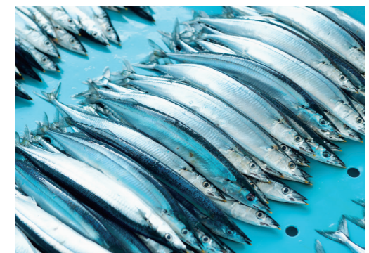
宮城県のサンマの水揚げ量は全国トップクラス。気仙沼、女川、で主に水揚げされます。

秋の味覚として愛されるサンマ。宮城の秋を代表する海の幸です。女川港、気仙沼漁港など、宮城県の水揚げ量は全国2位(平成28年度)です。 サンマは8月頃千島列島から南下を始め、主に秋から冬にかけて太平洋で産卵します。南下する体力をつけるために体に脂肪を蓄えるサンマは、9月から10月にかけて美味しさのピークを迎えます。 たっぷりの大根おろしを添えた熱々の塩焼きが定番ですが、すり身にして大根や白菜などの野菜と一緒に汁物に仕立てたすり身汁もよく食べられています。 サンマを水洗いして三枚におろし、ハラスや小骨を除いて包丁の峰で叩き、味噌、おろし生姜、片栗粉を加えてすり身にします。鍋に水と短