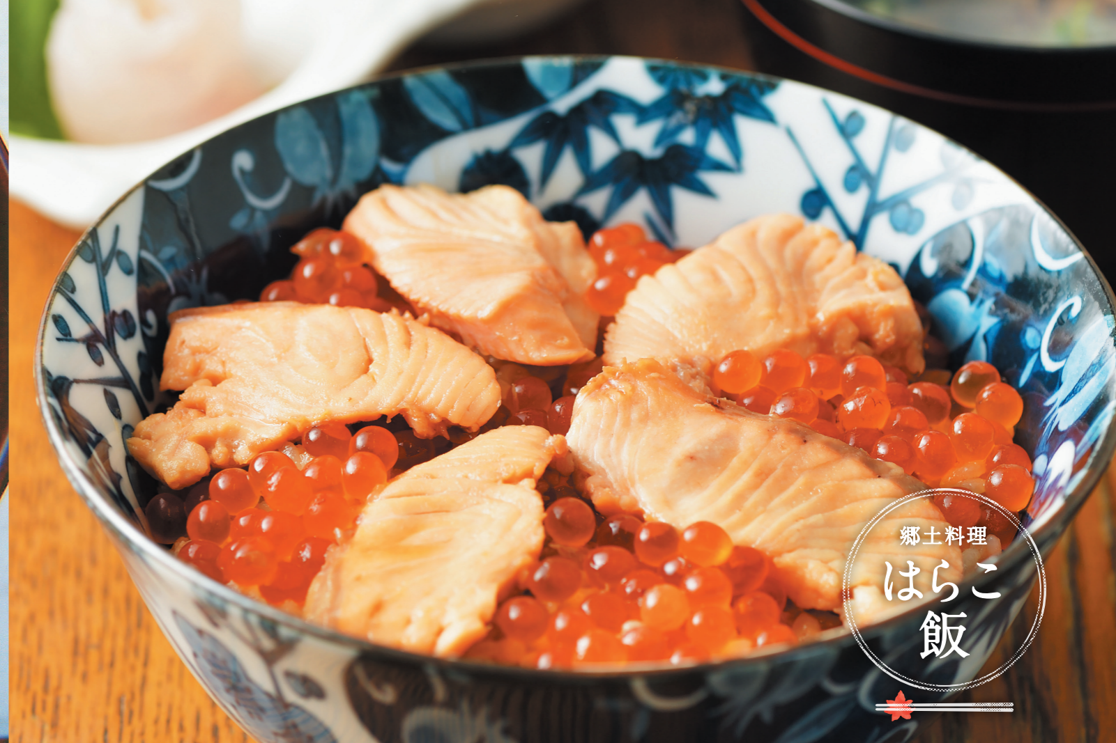
郷土料理 はらこ飯