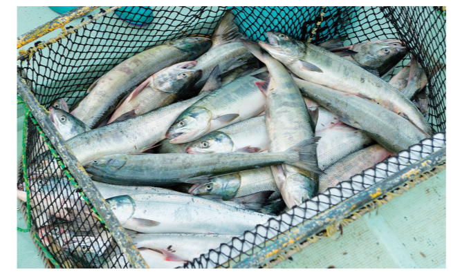
巨理町の荒浜漁港では、10月上旬から12月初旬頃までシロザケが水揚げされます。

巨理町荒浜地区が発祥といわれる「はらこ飯」は宮城を代表する郷土料理のひとつです。 はらこ飯の主役である「秋鮭」は、10月下旬から11月中旬にかけて旬を迎える「シロザケ」という種類。鮭にはシロザケ、ベニザケ、ギンザケなど様々な種類がありますが、日本の川に遡上するほとんどはシロザケで、秋にとれるシロザケを「秋鮭」、春から初夏にかけて回遊の途中に漁獲される若いシロザケを「時鮭（トキシラズ）」と呼びます。 「はらこ飯」は、旬の脂の乗った鮭を醤油、砂糖、酒などで煮込み、その煮汁でご飯を炊いて、鮭の身とイクラをのせた料理です。 宮城の郷土料理として県内各地の各家庭でも作られています。