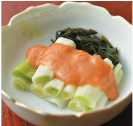
曲がりねぎの辛子酢味噌がけ

曲がりねぎは「やとい」と呼ばれる独特な栽培法で作られるねぎ。仙台市岩切余目地区で栽培が始まりました。この地域は地下水が地上近くにあるため、「一本立ちねぎ」の生産には適していませんでした。そこで当時の農家たちが考えついたのが「やとい」という栽培法です。 「やとい」とは、ある程度生育したねぎをいったん掘り起し、30度ほどの傾斜をつけた土の上に寝かせ土で覆う栽培方法です。3か月ほど寝かせていると、ねぎは太陽に向かって起き上がろうとし、曲がって成長していきます。このときに受けるストレスにより、とろけるような舌触り、甘み、深いコクが楽しめます。