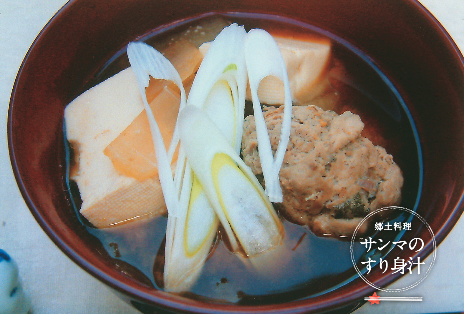
郷土料理 サンマの すり身汁