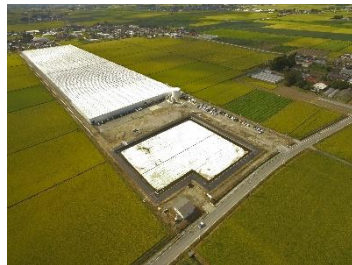
【美里グリーンベース 外観】

本施設では、育苗、定植、栽培管理の様々なステップが自動化されており、年間を通じて、1日当たり3~4万株のレタスを安定的に生産することが可能です。